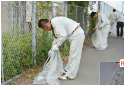
▲もくもくとゴミを拾っていきます。小さなゴミも見逃しません!

出合大橋の松前側を起点に、4班に分かれて歩道のごみを集めました。車から投げ捨てられたと思われる煙草の吸殻が、中でも多く見られました。