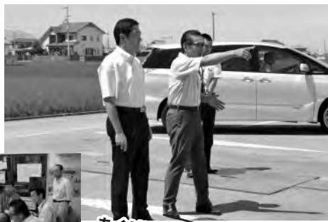
あぐりは地域に貢献しているカメ!