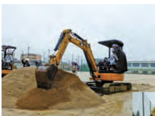
▲プロのお手本 皆、真剣に取り組んでくれました!▶

見ることも珍しい重機に乗り、さらに操縦もできるとあって子供たちはそれぞれにこの貴重な体験を楽しんだ様子でした。この様子は、当日のニュースや、後日新聞で取り上げられました。(愛亀グループ)