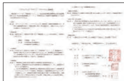
ボランティアサポートプログラム協定書と確認書