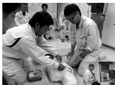
▲AEDの使用方法を学びました。