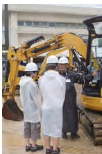
▲重機に乗る前にしっかりと説明を聞いています。