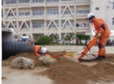
▲無事、救助できました!