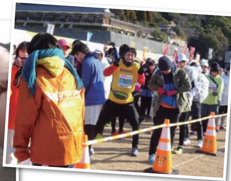
◀スタート前テンションが上がっています