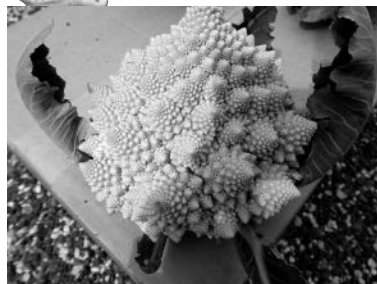
▲鮮やかなライムグリーンの『ロマネスコ』