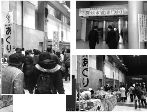
あぐりのブースに並ぶたくさんのお客様

写真を撮りに行った私も急ぎよ販売をお手伝いしなければならぬほどの人が来てくださっていました。また、テレビ局のカメラがあぐりのブースを映しており、注目度の高さが伺えました。