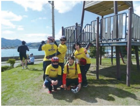
▲エイドステーションにて集合写真

先日、サイクリングしまなみ2018の今治・大島の往復30kmに初めて参加しましたが、天候にも恵まれ最高のサイクリン