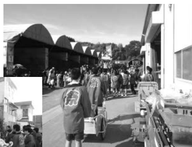
▲松前プラントにお神輿がやって来ました