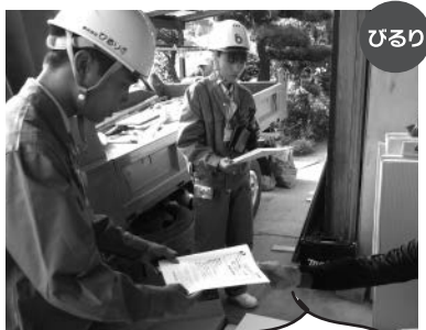
実際の現場も見学しました!