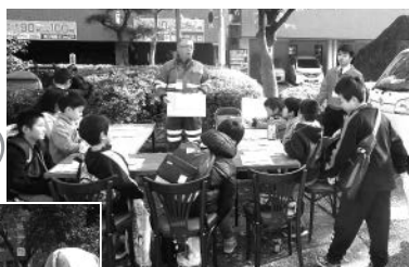
▲まずは説明を受けます

「キッズジヨブまつやま2019」に参加しました。子ども達に道路作りのお仕事を学んでいただきました。 東の谷のワンちゃんも頑張りました!!