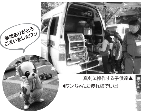
▲真剣に操作する子供達