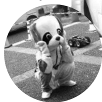
参加ありがとうございました