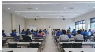
竣工祭の様子▶ 集合写真▼