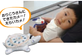
「ありごうさんにできたらカメラ～！えらいカメラ！」

今ではすっかり古びて見える旧社屋に「これまでありがとうとございませう。お疲れ様でした」と心の中でつぶやいた。