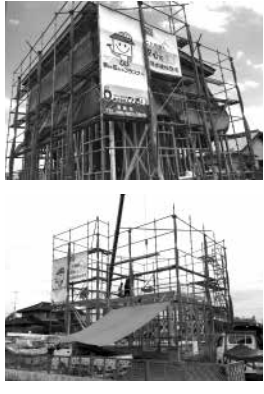
「6月27日(土)にあぐりの松田様邸の建て方をしました。建て方とは、家の主な構造となる材料を組み立てる事です。あいくりの雨天でしたが、現場監督含め協力会社の皆さんのおかげで無事に終わることができました。9月末まで工事は続きますが、安全に作業を進めていきたいと思っております。 〈ひのり／信藤七海〉

「6月27日(土)にあぐりの松田様邸の建て方をしました。建て方とは、家の主な構造となる材料を組み立てる事です。あいくりの雨天でしたが、現場監督含め協力会社の皆さんのおかげで無事に終わることができました。9月末まで工事は続きますが、安全に作業を進めていきたいと思っております。