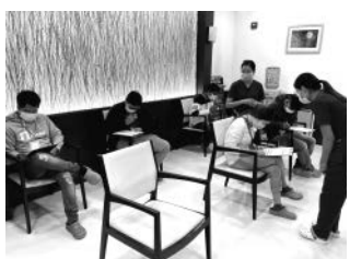
University of Health Sciences内UHS/JATA Medical Diagnostic Centerにて問診票に記入するカンボジア人スタッフたち。