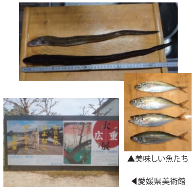
▲美味しい魚たち ▼愛媛県美術館

また、美術館巡りは、この頃は県美術館での展示物を鑑賞しております。愛媛県美術館は、2か月程度の間隔で展示品変わる企画展に重視した美術館であり、骨董品から絵画、写真展示まで多岐にわたる展示品を鑑賞することができ、コロナ禍で県外への外出が控えるべき現在でも多くを識ることのできるスポットだと感じております。検温や消毒などの対策もバッチリですので、是非とも赴いてみることをお勧めします。