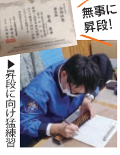
▶昇段に向け猛練習